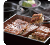
うなぎ割烹「一慎」 蒲焼