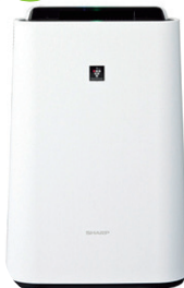
シャープ 加湿空気清浄機 エアクリナー