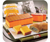
「杉谷本舗」五三焼 かすてら詰め合わせ