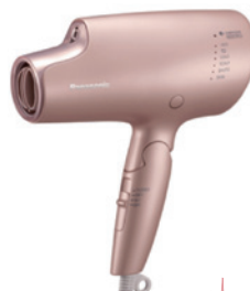
パナソニック ヘアードライヤー ナノケア