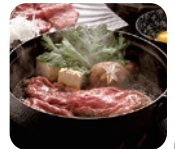
上州牛 すきやき肉