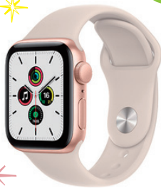
Apple Apple Watch SE (GPSモデル) 40mm