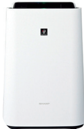
シャープ 加湿空気清浄機 エアクリナー