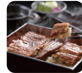
うなぎ割烹「一頓」 蒲焼