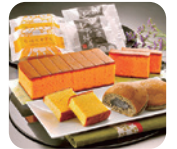
「杉谷本舗」五三焼 かすてら詰め合わせ