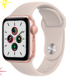
Apple Apple Watch SE (GPSモデル) 40mm