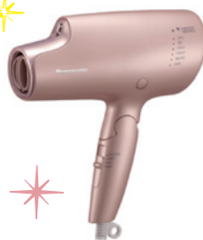
パナソニック ヘアードライヤー ナノケア