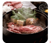
上州牛 すきやき肉