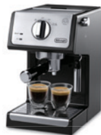
テロンキ アクティブ エスプレッソ・カプチーノメーカー