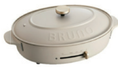
BRUNO オールホットプレート ハーフプレート&グリルプレートセット