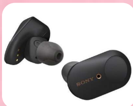
SONYワイヤレスイヤホン (ハイレンジ高級イヤホン)