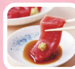
天然南まぐろ赤身