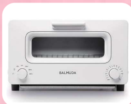
バルミュータ スチームオーブントースター