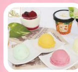
フルーツアラアイス