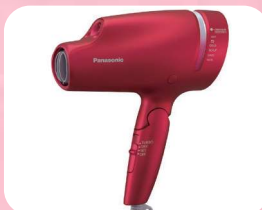
パナソニックヘアドライヤー (nanoe MOISTURE+)